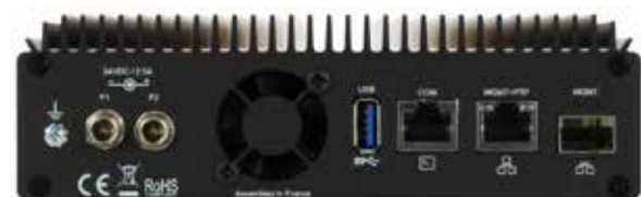
IOTA 10 CORE + 背面