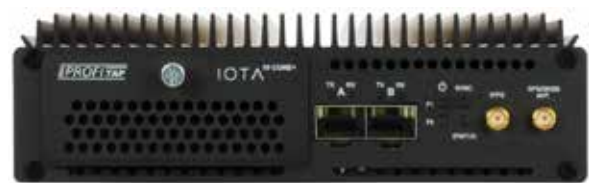
IOTA 10 CORE + 前面